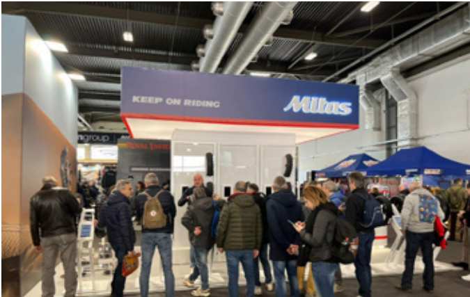
Motor Bike Expo (Verona, Italien)